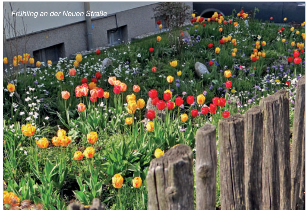
Frühling an der Neuen Straße

In den folgenden Monaten wird auch in den Ortsteilen auf den kommunalen Straßen die Straßenreinigung durch die Fa. Schaller durchgeführt.