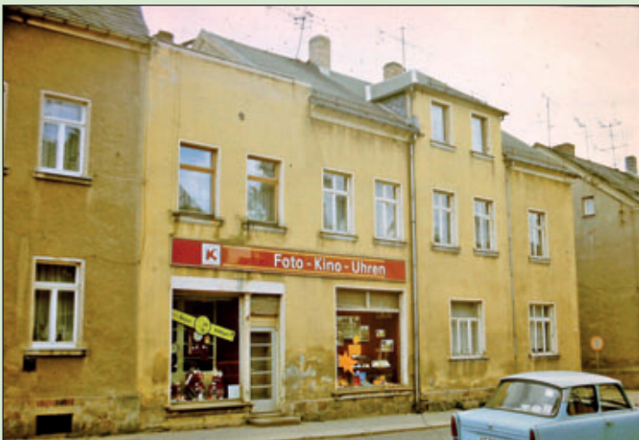
Haus Obere Hauptstraße 5