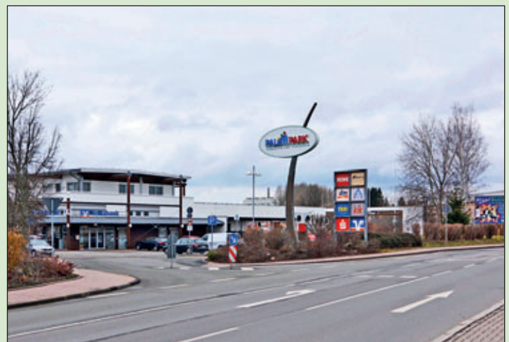
Das beliebte Einkaufszentrum Paletti-Park heute – über die aktuellen Pläne lesen Sie bitte im Bericht über den Technischen Ausschuss, Seite 8, Beschlüsse 2 und 3