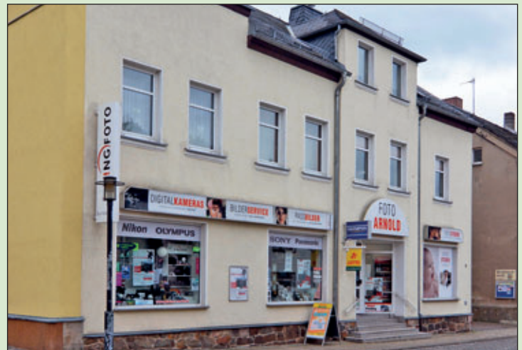
Geschäft FOTO ARNOLD, Obere Hauptstraße 5