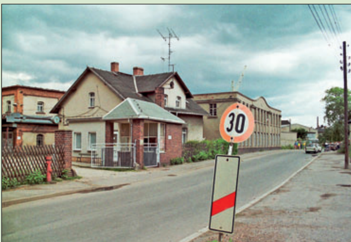
1990 verkaufte der Paletti-Park seine Ware noch in einer Halle der früheren Kammgarnspinnerei (hier die Einfahrt Kammgarnspinnerei, Chemnitzer Straße) als Provisorium.