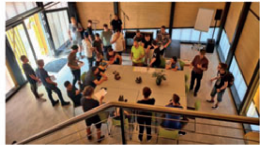
Impressionen vom 1. Ideenfrühstück / Fotos vom 1. Ideenfrühstück