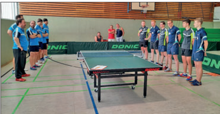
Beide Mannschaften vor dem Freundschaftsspiel