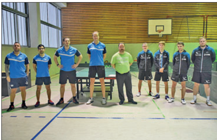
Das letzte Spiel der Hinrunde zwischen TTC Lugau und TTC Holzhausen, vor dem Spiel die Begrüßung

Im Sonntagnachmittag-Spiel zwischen Lugau und Holzhausen waren sich beide Teams ebenbürtig. Die Entscheidung wurde bis zum letzten Ballwechsel vertagt. In den Doppelspielen wurde schon hoch klassisches Tischtennis geboten. Bei den Lugauern fehlte